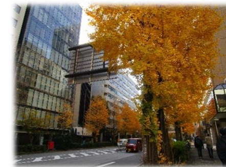
桜田通り沿いの イチヨウ並木