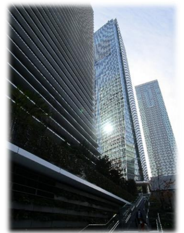
虎ノ門ヒルズ森タワー