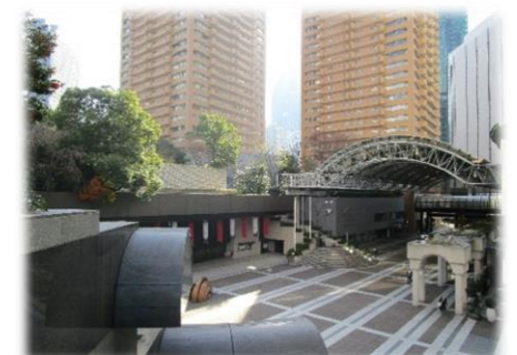
アーク・カラヤン広場