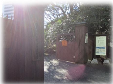
旧芝離宮恩賜庭園