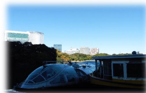
竹芝地区船着き場

このようにしてコースができました。 ご協力いただいた皆様ありがとうございました。