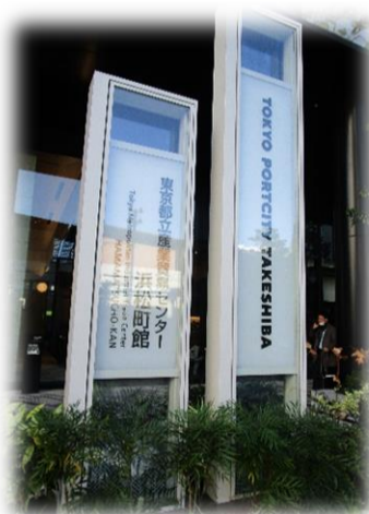
東京ポートシティ竹芝