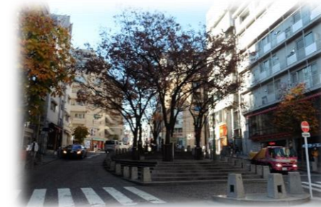
麻布十番パティオ