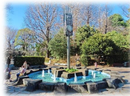
有栖川宮記念公園