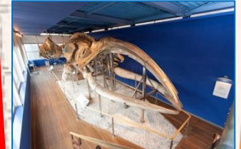
セミクジラ全身骨格標本