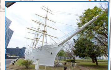
登録有形文化財「雲鷹丸」

全行程（2kmほど）段差を気にせずお散歩ができます。汐の公園から杜の公園への道も安心して通れます。品川インターシティC棟にはニコンの見ごたえのあるミュージアムがあります。また、通路をわたりキャノンSタワー2Fにはキャノンのショールームがあり各種イベントが楽しめます。